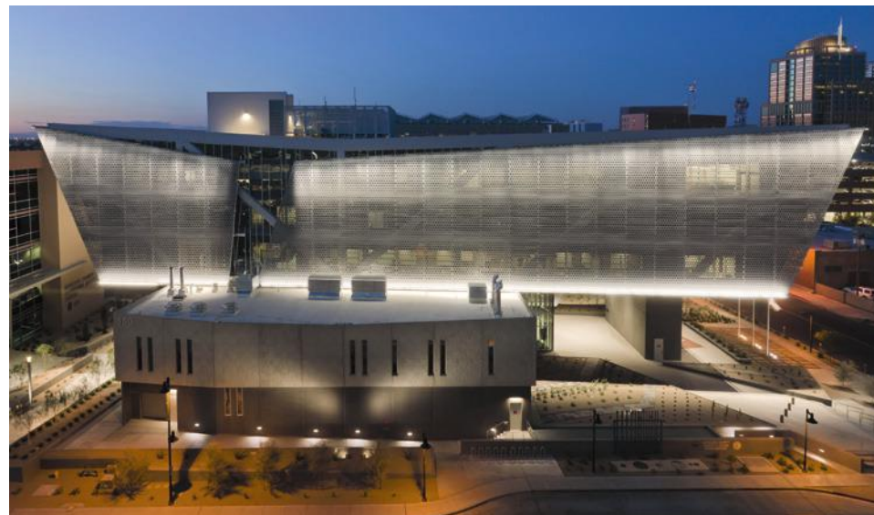
Maricopa County, Phoenix Arizona (VS) Techniek: Geperforeerd zink Architect: Gabor Lorant Architects, Inc. Oppervlakteaspect: QUARTZ-ZINC