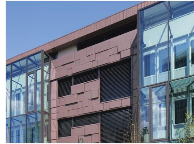
Étude notariale, Bordeaux (Frankrijk) Techniek: VMZ Gevelpaneel, VMZ Mozaïek Architect: Agence Teisseire & Toutou Oppervlakteaspect: PIGMENTO rood